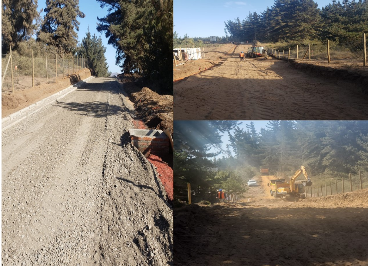
LOS PINOS 2 - INMOBILIARIA TREI