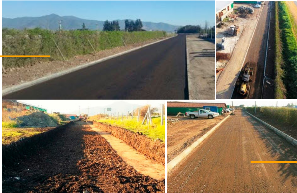
• ACCESO PRINCIPAL MADERAS ORELLANA | QUILLOTA