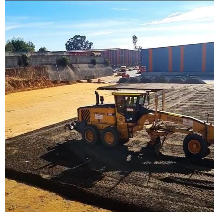
SUBESTACION ELECTRICA CASABLANCA – ELECNOR