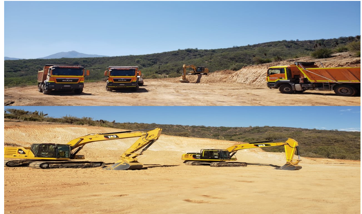
SPA AÑAÑUCAS - CONSTRUCTORA IMPROMEC