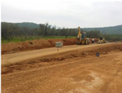
• CANCHA EQUITACIÓN Y CALLE ACCESO | CAMPOS DHELOS 08 · 2016