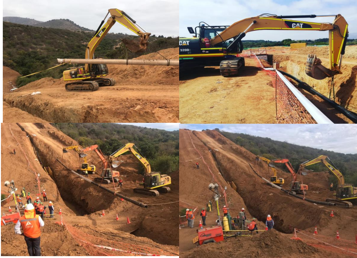
EXCAVACION E INSTALACION TUBERIAS LOS AROMOS 3 Y 4 – AGG Y FLESAN