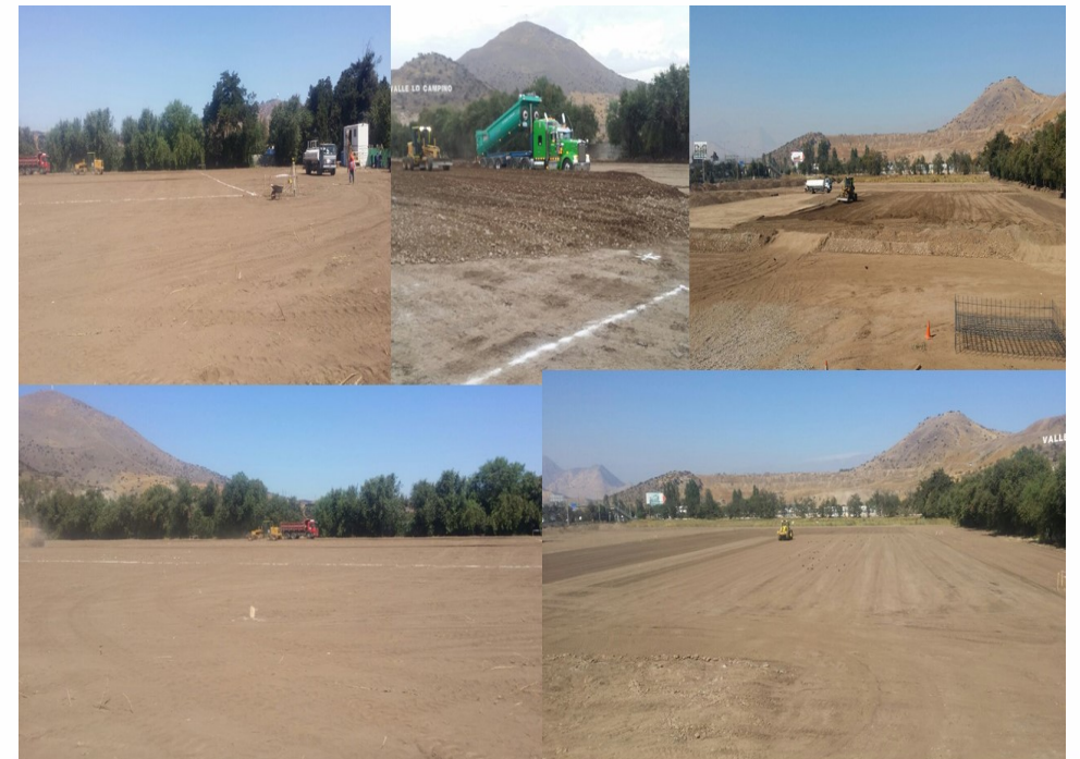
• LIDER LO CAMPINO - CONSTRUCTORA DPC