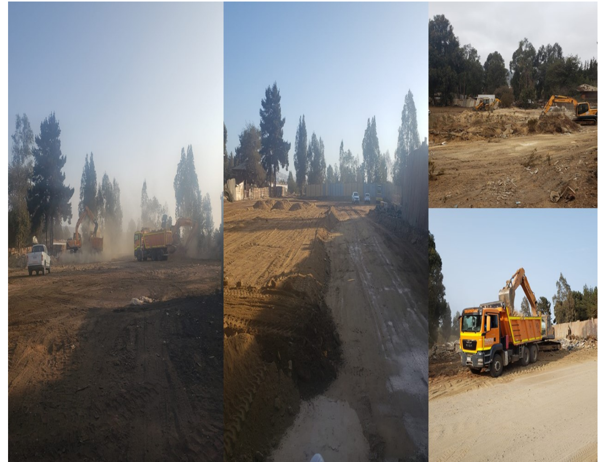
PATIO GRUAS - EMPRESA M10