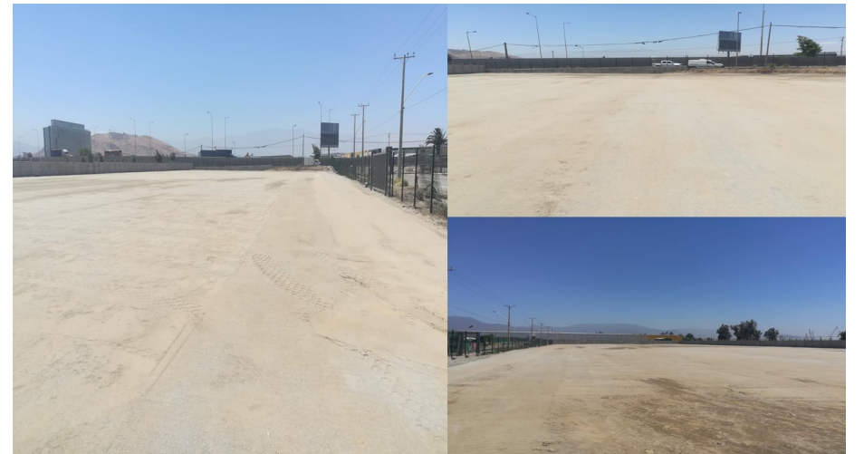
AEROPARQUE - CONSTRUCTORA ROSSELOT