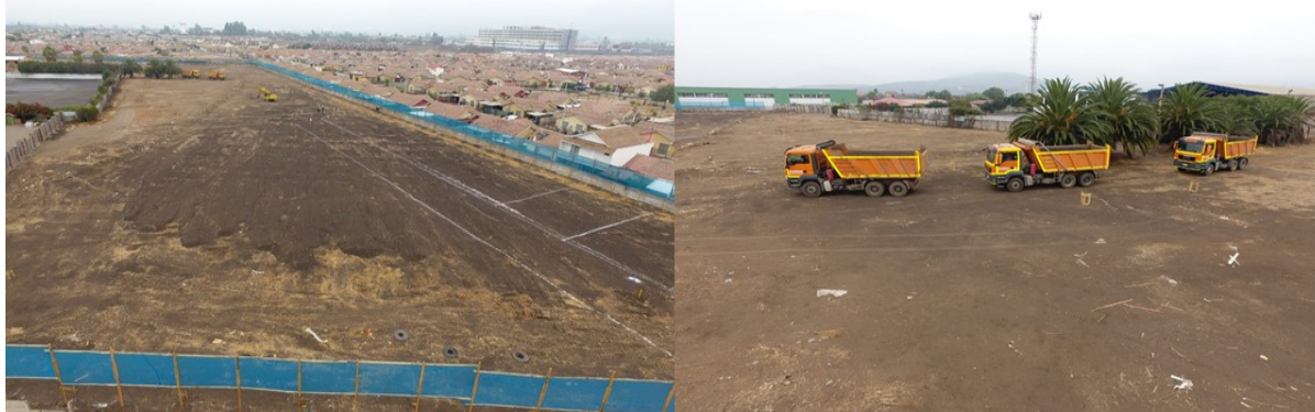
CONJUNTO HABITACIONAL - CONSTRUCTORA GREPSA