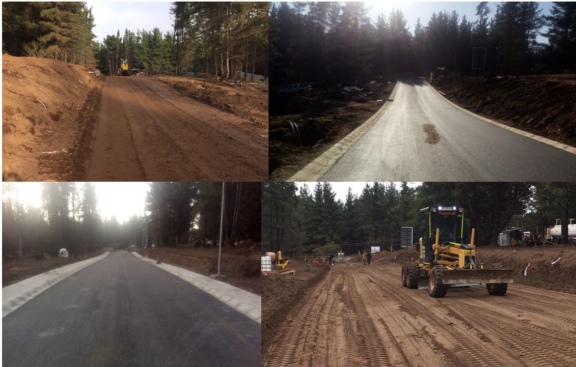
URBANIZACION LOS PINOS 1 - INMOBILIARIA TREI