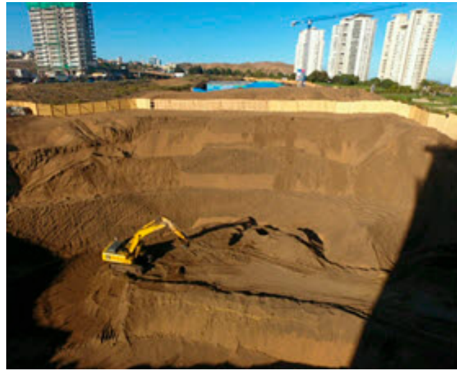
• CONSTRUCTORA RAPEL | EXCAVACIÓN 50.000 M 3