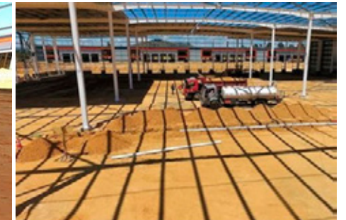
• CONSTRUCTORA DPC | CONCÓN PATIO NAVES