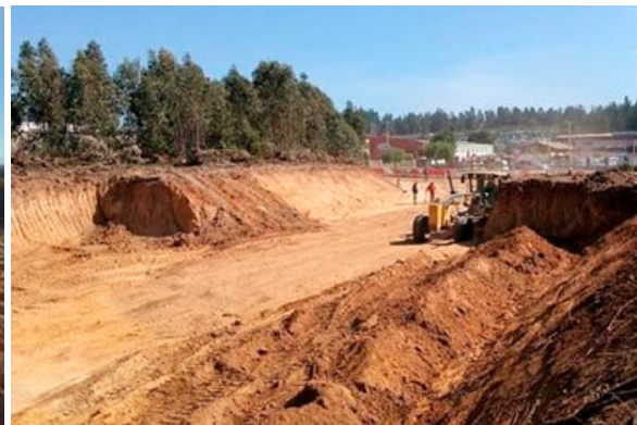
• CONSTRUCTORA DPC | CONCÓN ACCESO BODEGAS