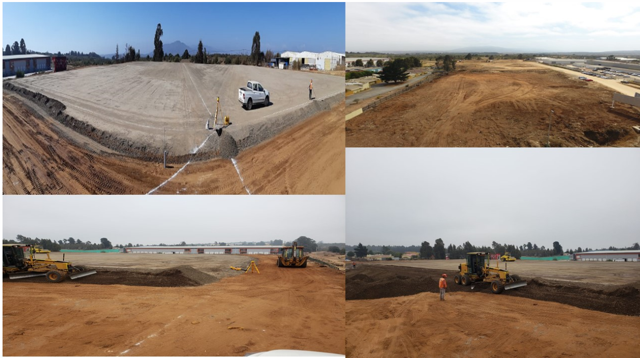
• CAMINO INTERNACIONAL - CONSTRUCTORA ROSSELOT