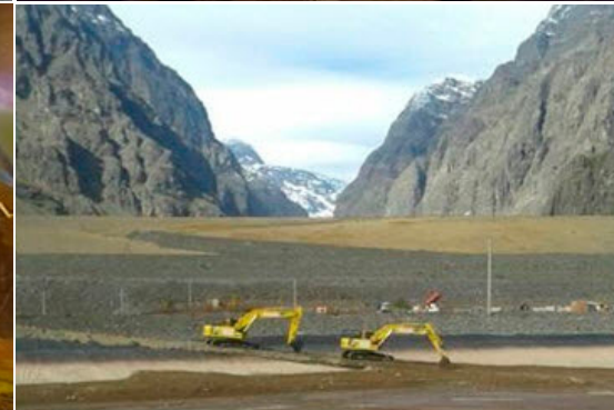
• LIMPIEZA TRANQUE PIUQUENITOS | COLBÚN · 06 · 2016