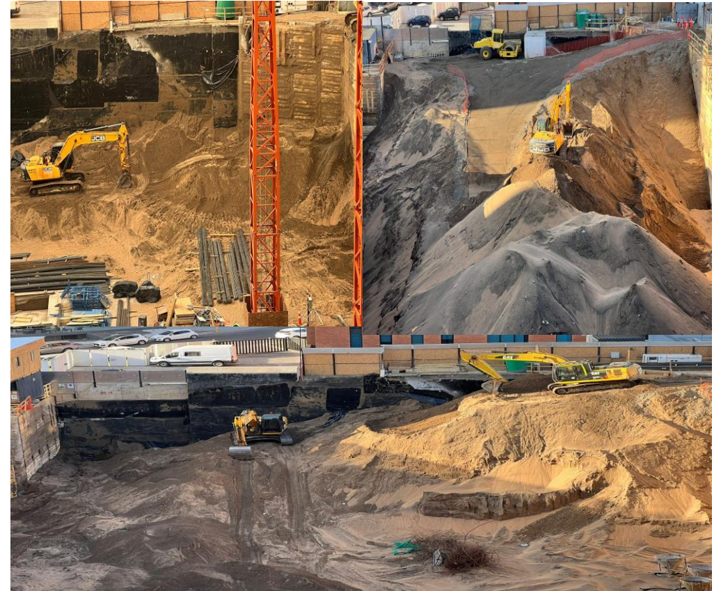
EXCAVACION EDIFICIO HOY ELUCHANS – CONSTRUCTORA DESCO