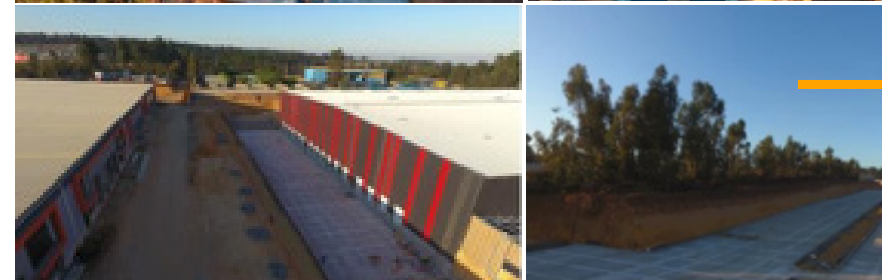
• DPC | 2017