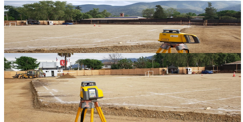
SANTA ISABEL OLMUE - CONSTRUCTORA DPC