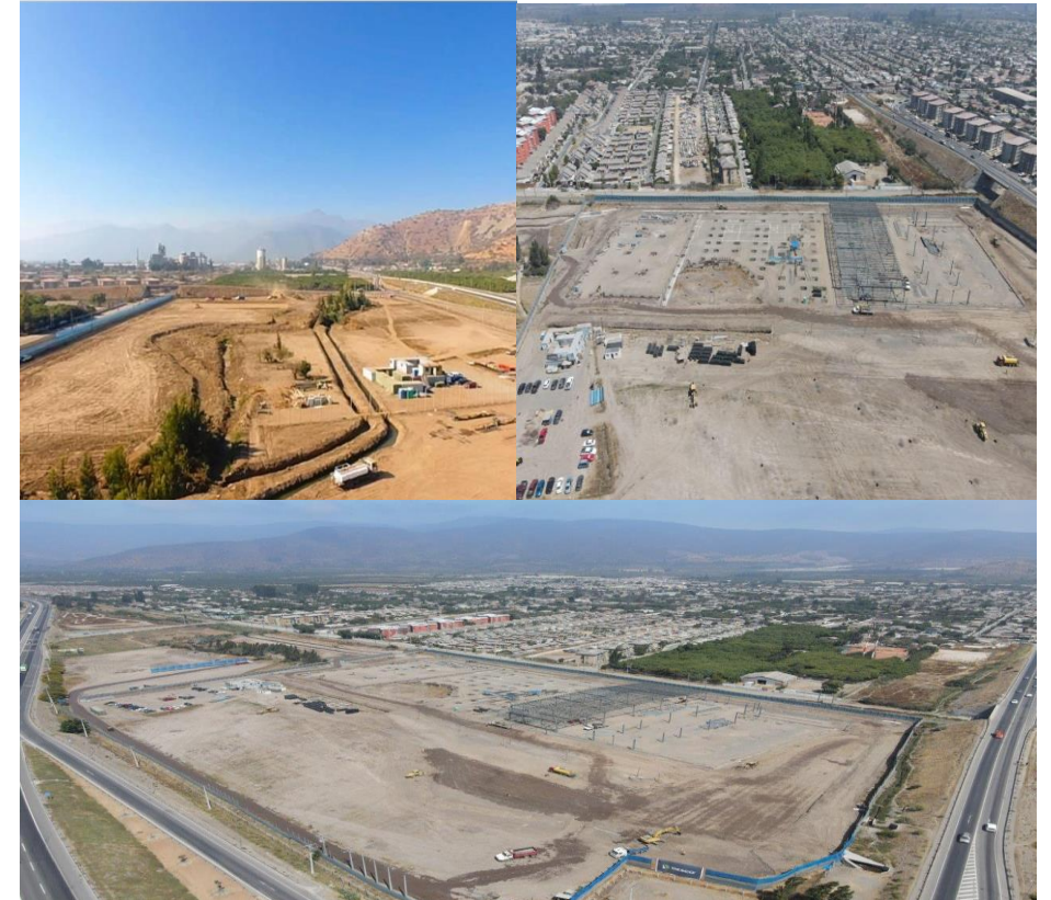
STRIP CENTER LA CALERA– CONSTRUCTORA DESCO