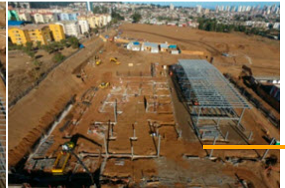
• CONSTRUCTORA INPROMEC | OBRA HIPERLIDER