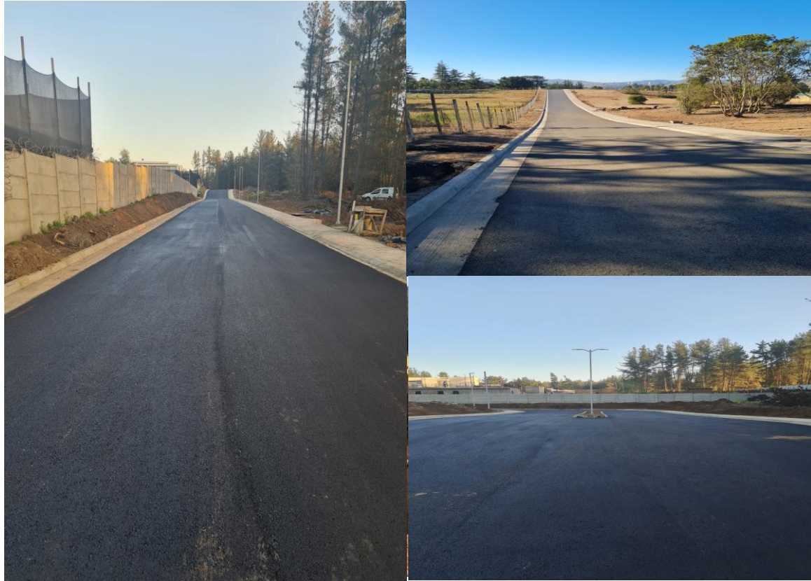
URBANIZACION LOS PINOS 4 Y 5- INMOBILIARIA TREI